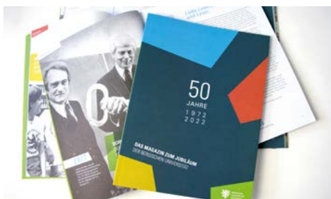
Lektüre zum Geburtstag: das Jubiläumsmagazin.

Die Bergische Universität startet offiziell in ihr Jubiläumsjahr