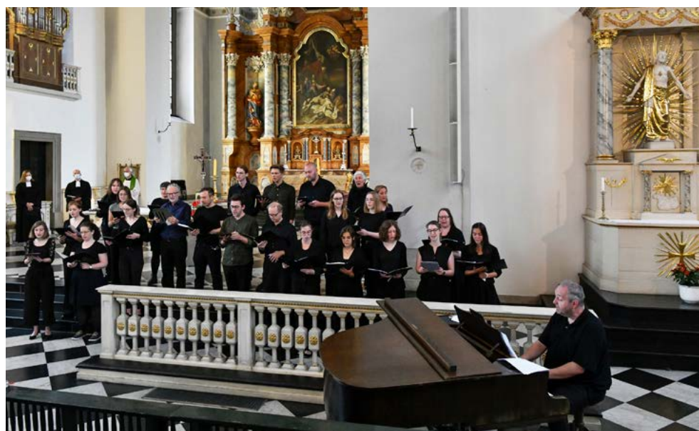
Der Festgottesdienst fand in der Basilika Sankt Laurentius mit dem UNI Chor und Orchester unter Leitung von Christoph Spengler statt.